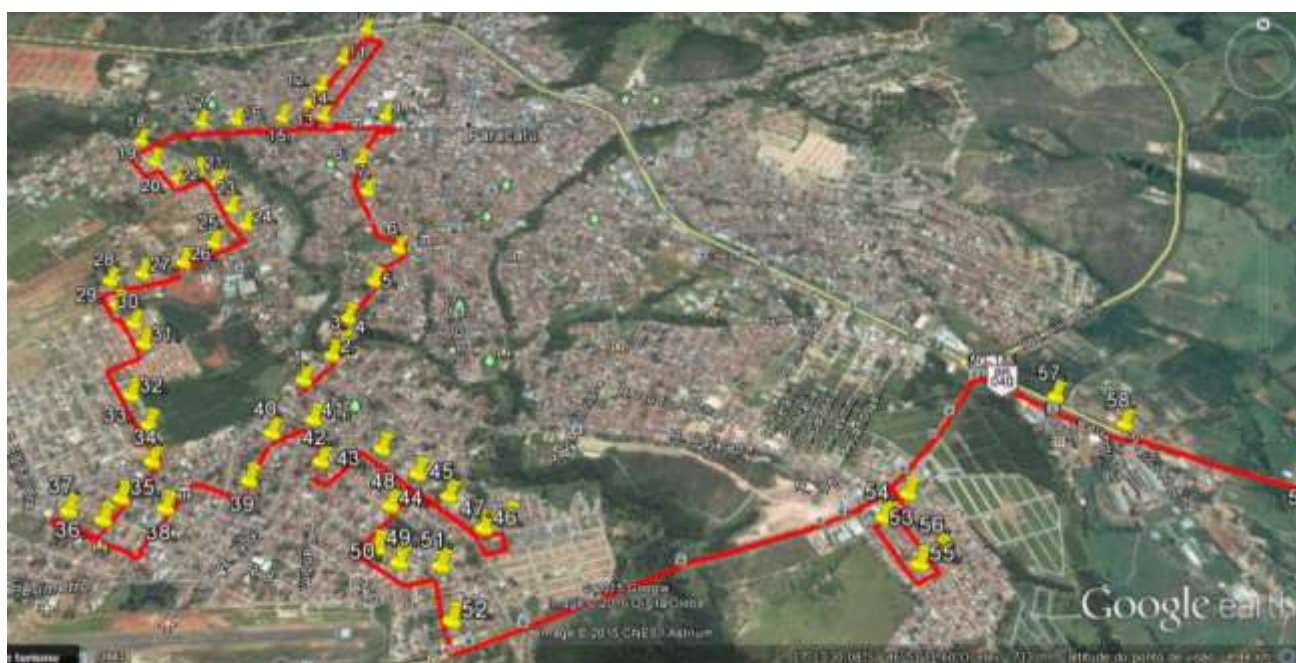
16.7 – Trajeto e Relação de pontos dentro do perímetro urbano