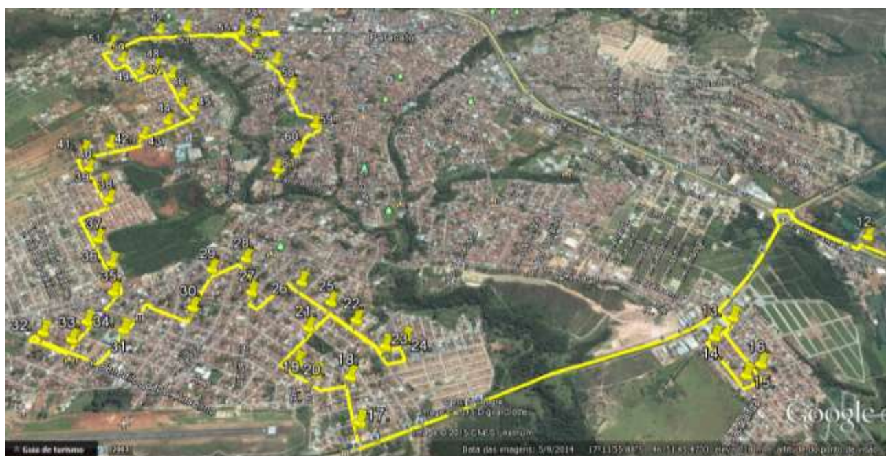
16.7 – Trajeto e Relação de pontos dentro do perímetro urbano